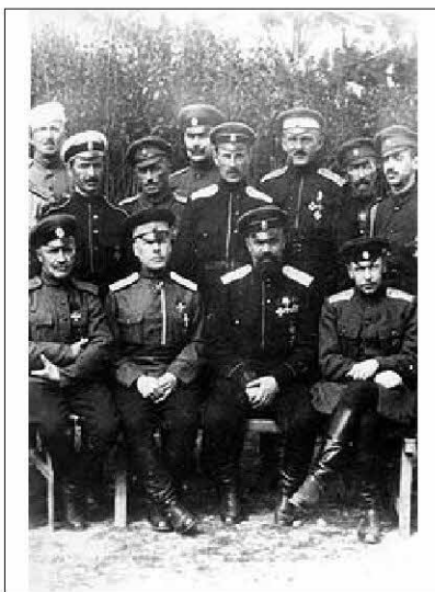
Генералы Белой армии в Болгарии. 20-ые годы

Самым крупным русским военным эмигрантским формированием в Болгарии был третий отдел Русского Общевоинского Союза (РОВС) с 70 отделами по всей стране. РОВС помогал домам ветеранов и сирот, больницам и амбулаториям для лечения эмигрантов, школам и гимназиям.